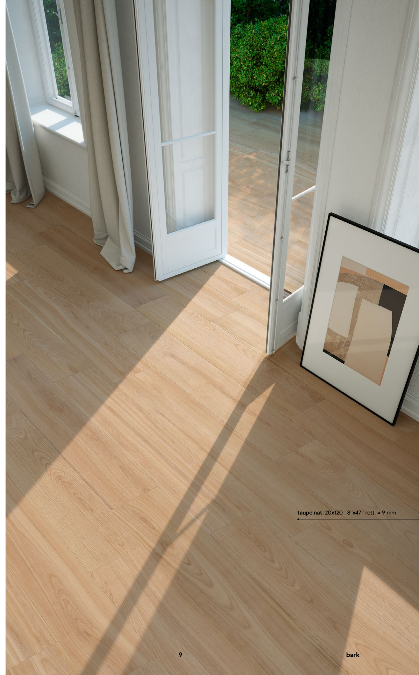
taupe nat. 20x120 . 8"x47" rett. ≈ 9 mm

Das Projekt der Hölzer aus Feinsteinzeug erweitert seine Schönheit von innen nach außen. Alle Farben sind in der praktischen rutschfesten Oberfläche für Außenbereiche erhältlich und diese Vielseitigkeit verleiht den Räumen eine unbezahlbare materielle und visuelle Kontinuität.