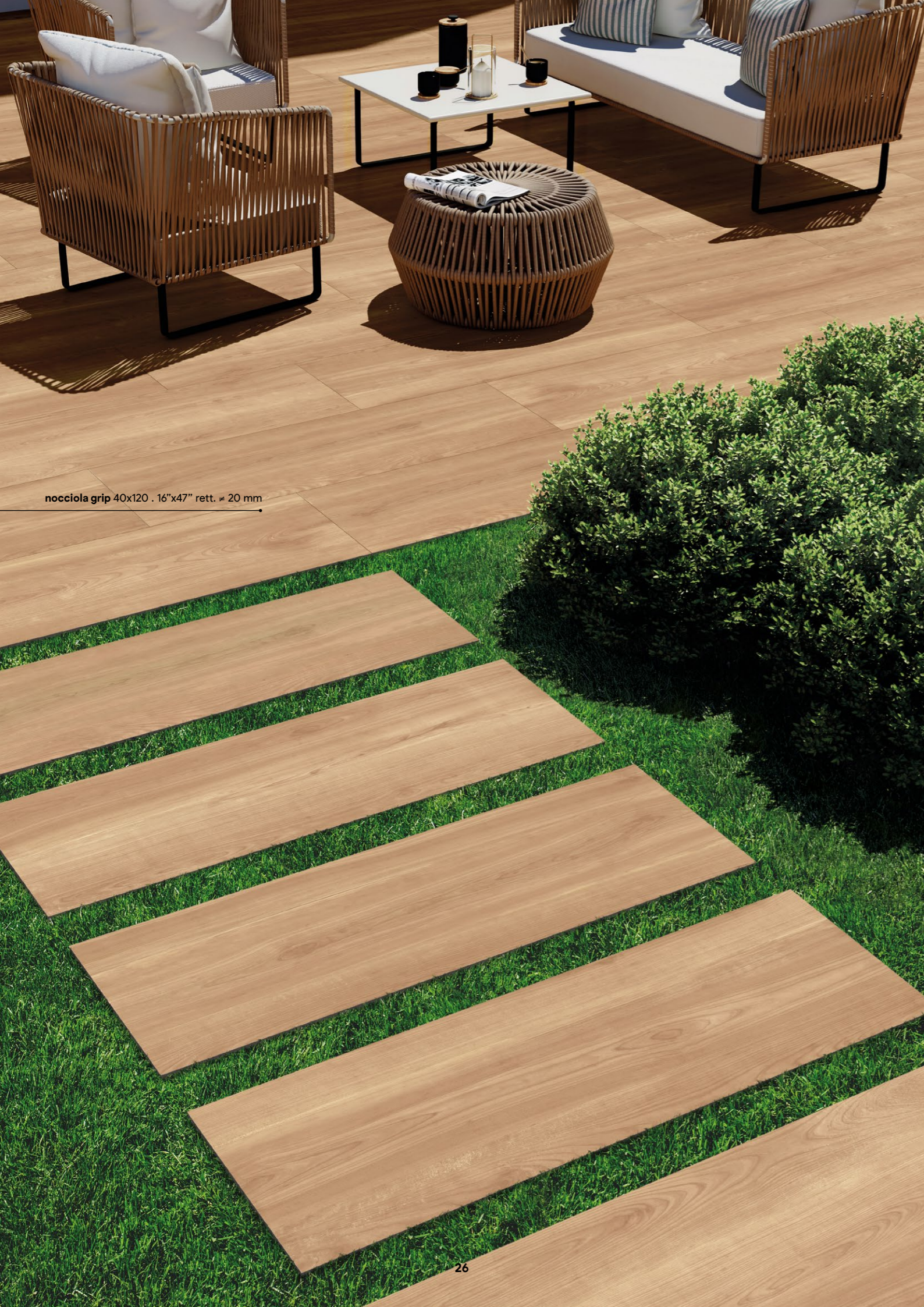
nocciola grip 40x120 . 16"x47" rett. ≈ 20 mm